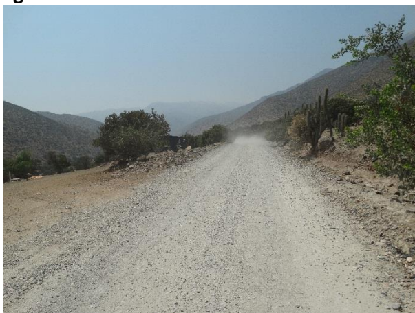
Imagen N°5: Paso de vehículo hacia Mina El Bronce

De los testimonios se puede inferir que antiguamente existía la costumbre de humedecer el camino, por parte de los anteriores propietarios de la mina, para prevenir con ello el levantamiento de polvo, lo que da a entender que esta sería una problemática que la comunidad enfrenta no solo actualmente y que durante el transcurso del tiempo se ha ido intentado paliar con medidas domésticas en las que media la voluntad de los involucrados.