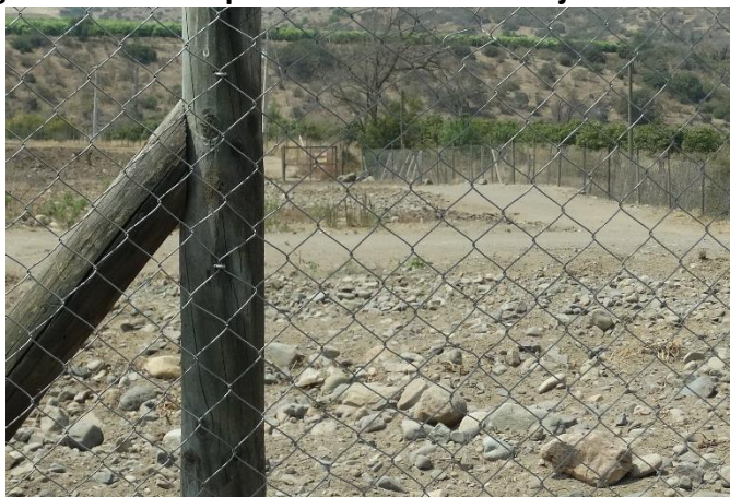
Imagen N° 2: Cierre perimetral actual en caja del Río Petorca