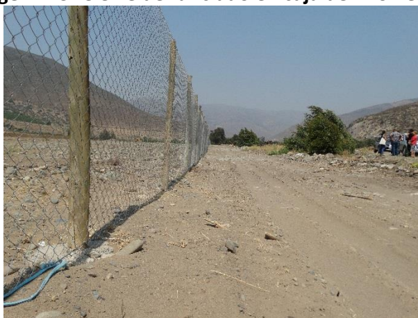
Imagen N°3: Cierre denunciado en caja del Río Petorca

Por último, la imagen N°3 permite dar cuenta de la penetración del cierre en la caja del río.